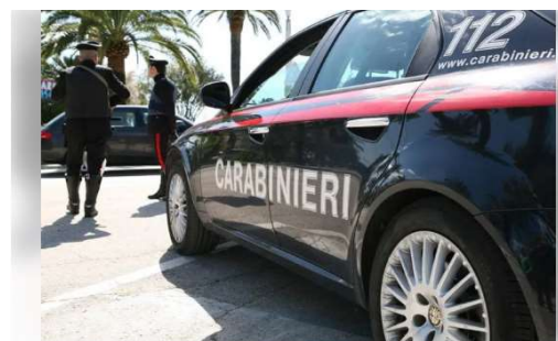
Un intervento dei carabinieri (foto di repertorio)