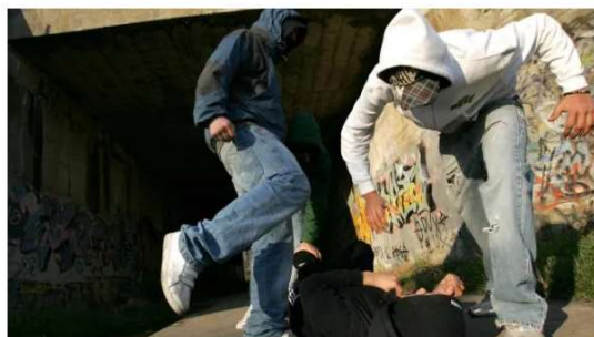
Sei giovani aggrediscono coetanei

I 'raid' sono stati messi a segno da un gruppetto di una decina di ragazzi nella zona del centro storico. Il procuratore Alfonso D'Avino: "Hanno tutti reati alle spalle"