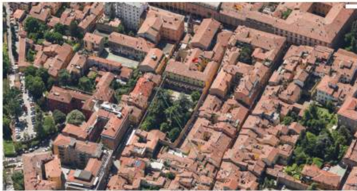
↙ Giardino monumentale protetto